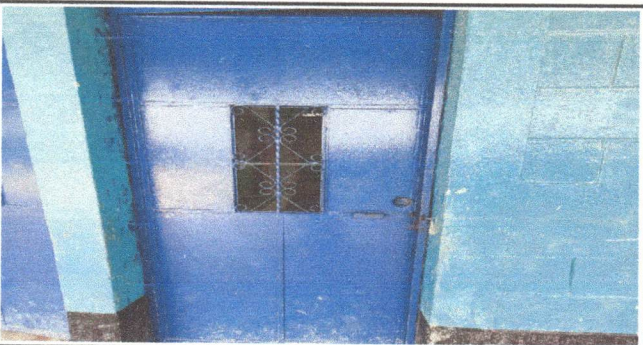
Foto 5. Chapas de puertas deterioradas.